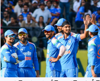
అగార్వల్, ప్రధాన కోచ్ గౌతమ్ గంభీర్ మధ్య పూర్తి సమన్వయం ఉందని బీసీసీఐ తెలిపింది. సెలెక్షన్లు, కోచింగ్ సిబ్బంది, జట్టు యాజమాన్యం అందరూ ఒకే లక్ష్యంతో పనిచేస్తున్నారని సైకియా వివరించారు. భవిష్యత్ అవసరాలను దృష్టిలో ఉంచుకొని జట్టును నిర్మించడంపై దృష్టి పెట్టామన్నారు. కేవలం తక్షణ ఫలితాలే కాకుండా 2027 వరల్డ్ కప్ ను లక్ష్యంగా చేసుకుని ఆటగాళ్ల ఎంపిక, జట్టు కూర్పు, వ్యూహాలపై నిర్ణయాలు తీసుకుంటున్నట్లు సంతకాలు ఇచ్చారు.

అఖండ సూర్య : 2023 వన్డే వరల్డ్ కప్ ఫైనల్ ఓటమి గాయం ఇంకా భారత క్రికెట్ అభిమానులను వెంటాడుతూనే ఉంది. స్వదేశంలో ఆజేయంగా ఫైనల్ చేరిన టీమిండియా చివరి అడుగులో తడబడి ట్రోఫీని చేజిక్కించుకుంది. ఇప్పుడు ఆ నిరాశను తుడిచిపెట్టి 2027లో మళ్లీ ప్రపంచ కప్ ను ముద్దాడాలనే లక్ష్యంతో భారత క్రికెట్ బోర్డు ముందడుగు వేస్తోంది. ఇందుకోసం ఇప్పటినుంచే ప్రత్యేక కార్యాచరణ రూపొందిస్తున్నట్లు బీసీసీఐ స్పష్టం చేసింది.